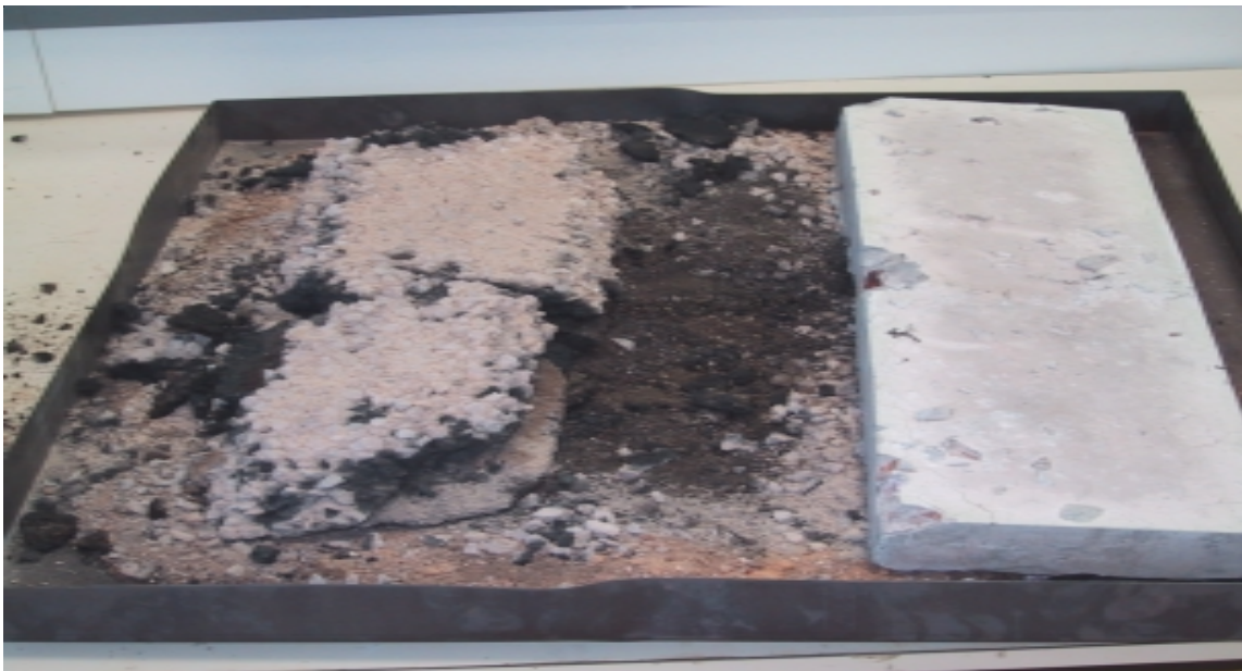
Figura 1: Confronto fra i provini in conglomerato bituminoso (sinistra) e in calcestruzzo (destra) dopo riscaldamento a 750°C

Le figure 1 e 2 mostrano i risultati della prova di riscaldamento in forno per un'ora di campioni prismatici in conglomerato bituminoso (a sinistra) e calcestruzzo (a destra) alla temperatura di 750°C secondo la curva ISO.